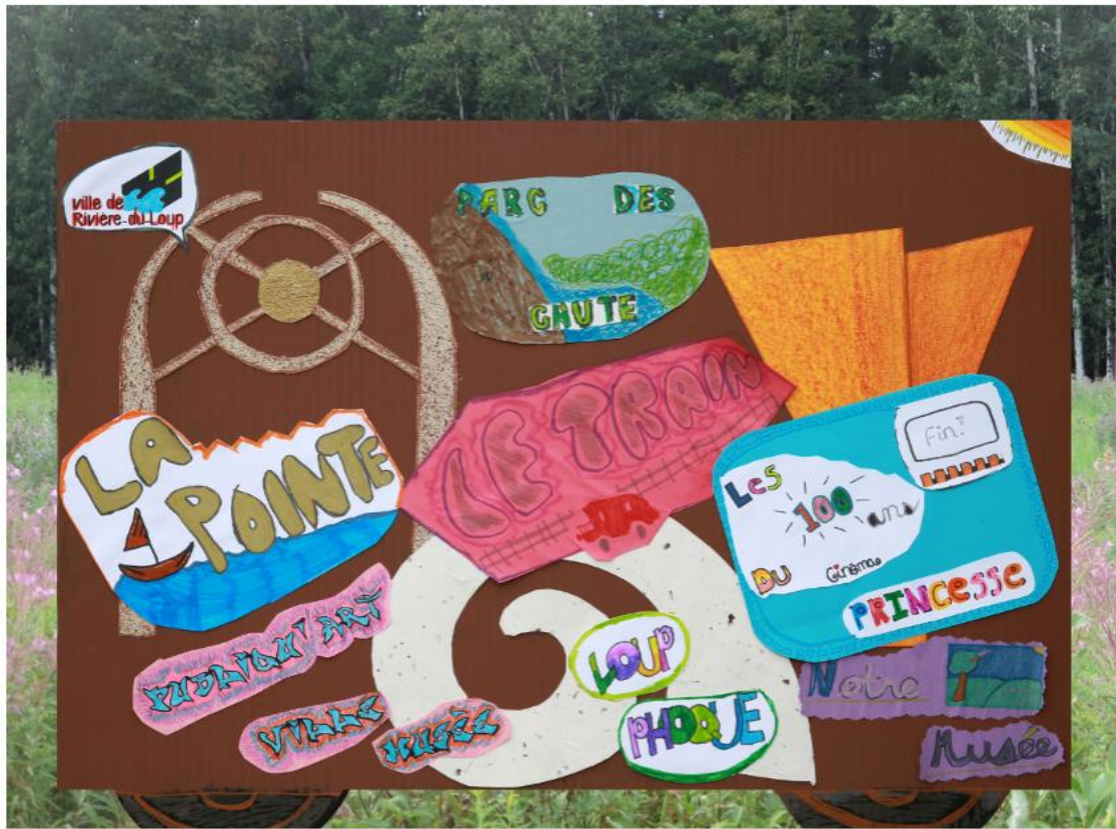
Nathalie a invité les enfants à choisir l'endroit où coller leur contribution dans l'oeuvre collective.