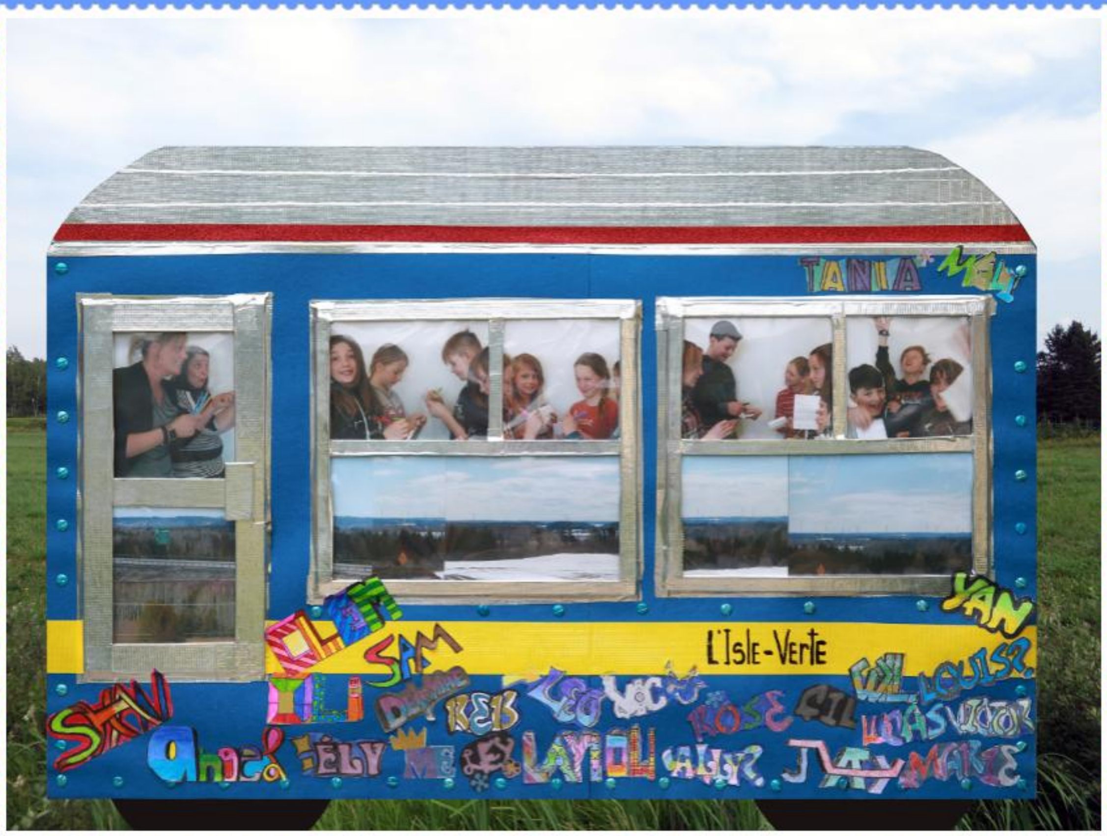
Les enfants rédigent leurs cadavres exquis sous l'oeil complice de leurs enseignantes.