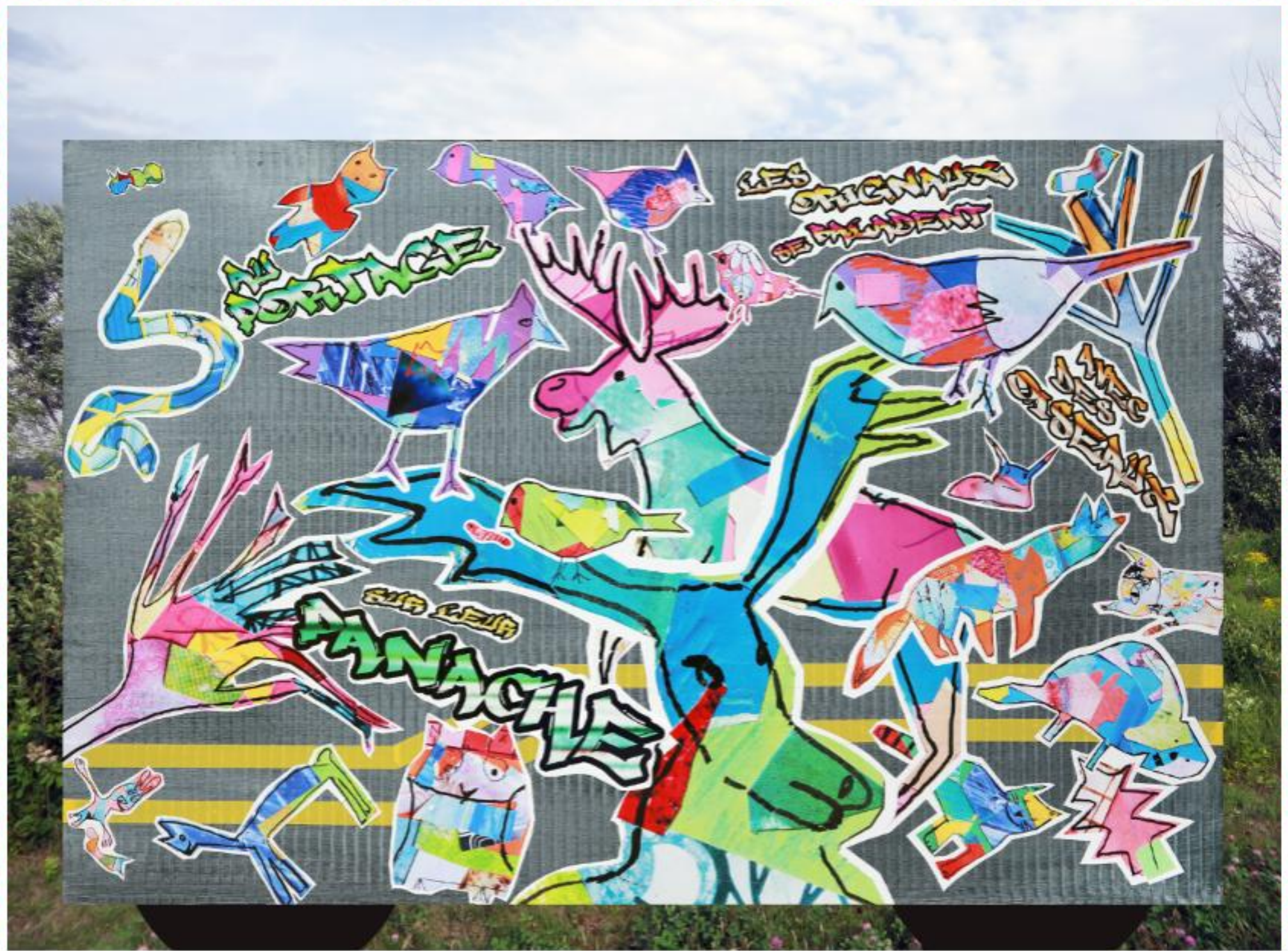
Au Portage, les originaux se baladent avec des oiseaux sur leur panache