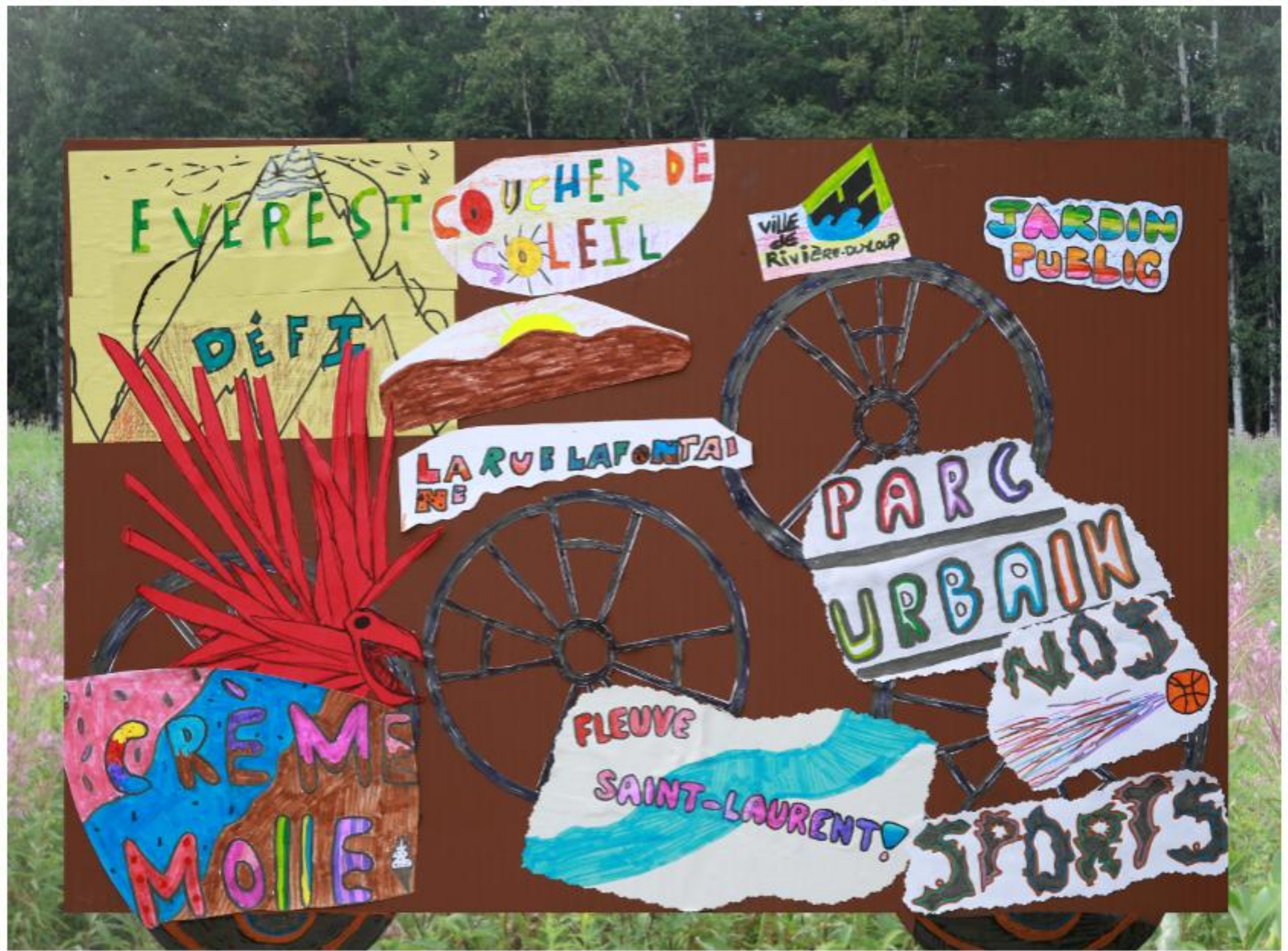
C'est donc un grand happening qui a donné naissance à ce wagon.