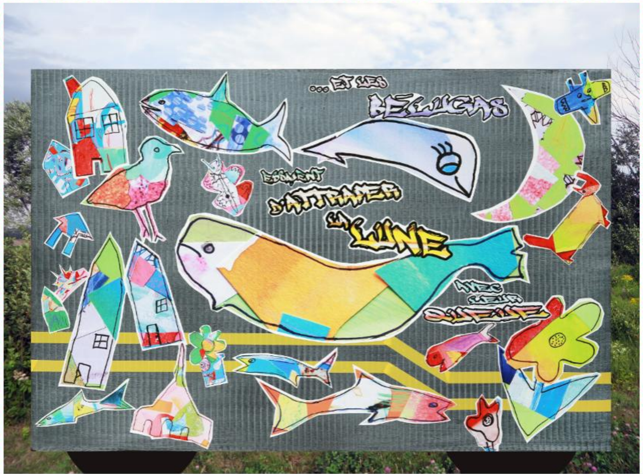
... et les bélugas essaient d'attraper la lune avec leur queue.