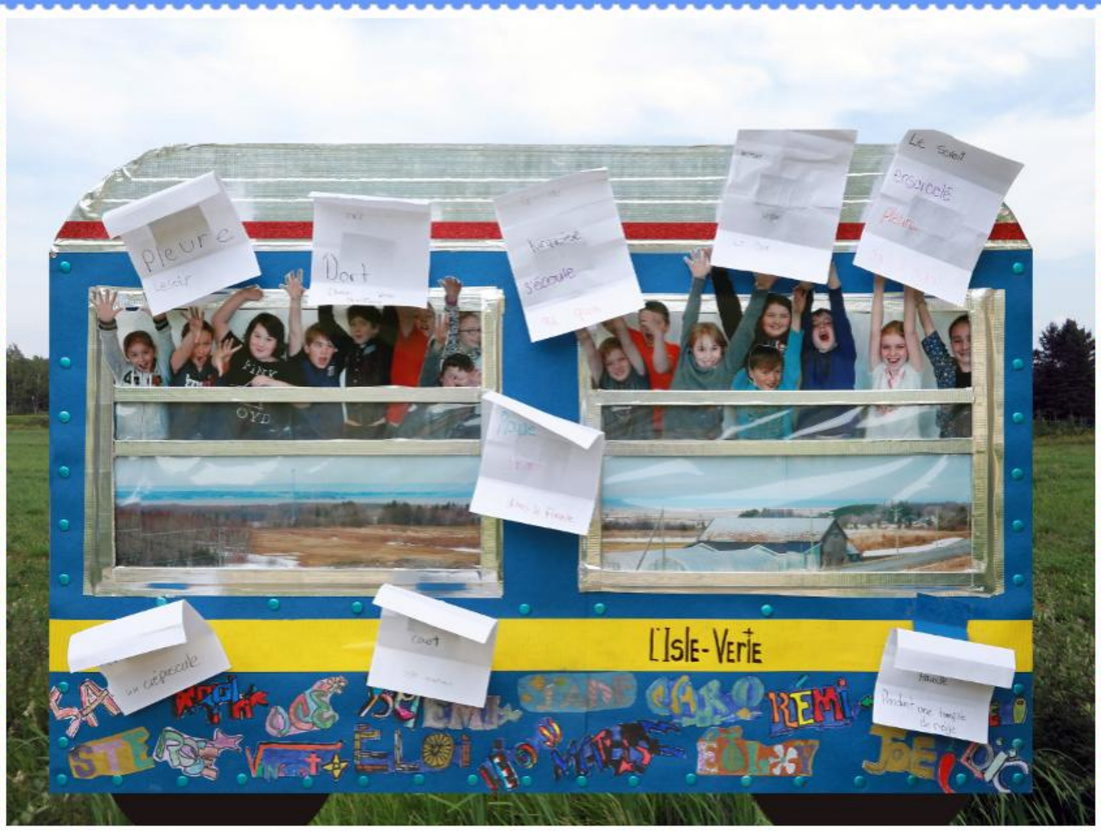
Puis, c'est le lancement, au sens propre comme au figuré, de leurs créations littéraires.